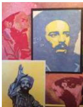
3 (1980, n°43, couverture et 4 ème de couverture)