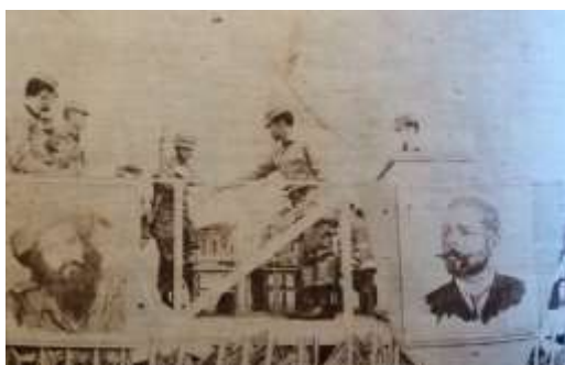
24 (1965, n°17, p. 42)