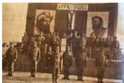
23 (1965, n°12, p. 12)