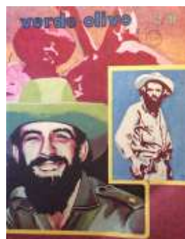
4 (1980, n°43, couverture et 4 ème de couverture)