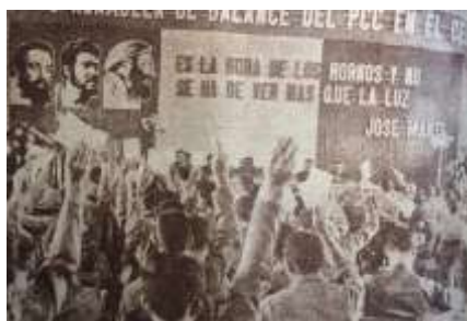
26 (1967, n°24, p. 20)