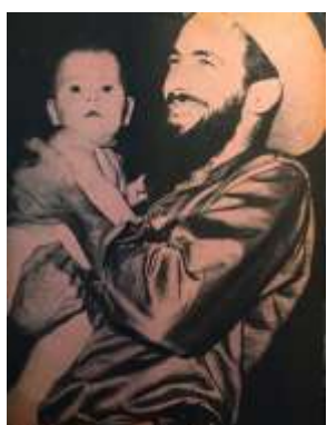
18 (1967, n°43, page cartonnée)