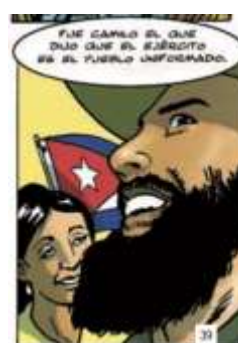
6 (2016, n°5, p. 41)