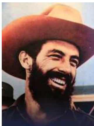
16 (1977, n°44, 4 ème de couverture)