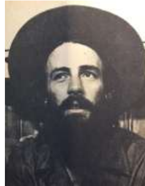
15 (1967, n°43, p. 2)