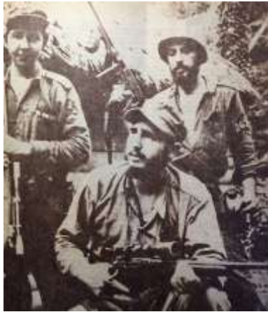
12 (1967, n°21, p. 21)

Camilo Cienfuegos, ses traits fins, sa longue barbe et ses longs cheveux qui vont devenir très à la mode dans les années suivantes (Alvizuri, 2012), son éternel sourire ( cf. illustrations 15 à 17), son allure christique, sa proximité avec les gens ( cf. illustration 18), autant d'éléments qui renforcent son potentiel de séduction et en font un personnage romantique que la mort prématurée n'a fait que renforcer. Par ailleurs, l'image de Camilo Cienfuegos apparaît fréquemment en arrière-plan de réunions ou de discours de dirigeants et de sympathisants castristes ( cf. illustrations 19 à 22) ou bien aux côtés de représentations d'autres martyrs de l'Indépendance cubaine ou de la Révolution castriste comme Ernesto Guevara, Frank País, Antonio Maceo ou José Martí ( cf. illustrations 23 à 28). Dans l'un et l'autre cas, à travers ces jeux de miroir, il s'agit d'établir une filiation : les intervenants encore en vie, au premier rang duquel Fidel Castro, apparaissent ainsi unis à Camilo Cienfuegos dont ils entendent prolonger la geste et l'héritage.