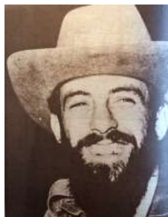
17 (1979, n°44, p. 30)