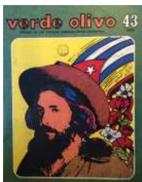
5 (1982, n°43, couverture)