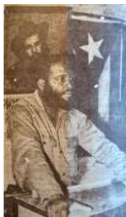
20 (1965, n°18, p. 8)