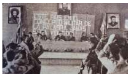
27 (1967, n°33, p. 31)