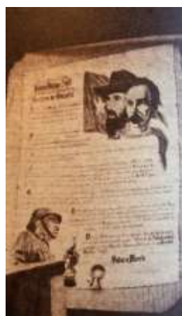
25 (1966, n°7, p. 22)