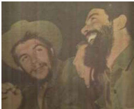
14 (1963, n°34, couverture)