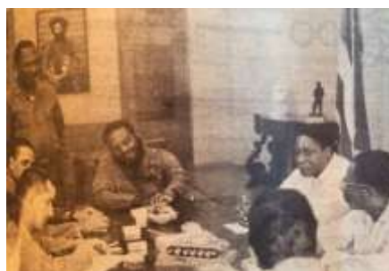
19 (1965, n°2, p. 65)