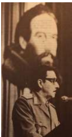
22 (1979, n°44, p. 8)