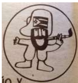
1 (1979, n°10, p. 60)