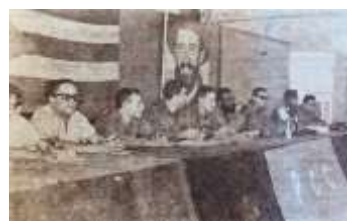
21 (1965, n°45, p. 57)