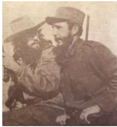
13 (1978, n°1, p. 3)