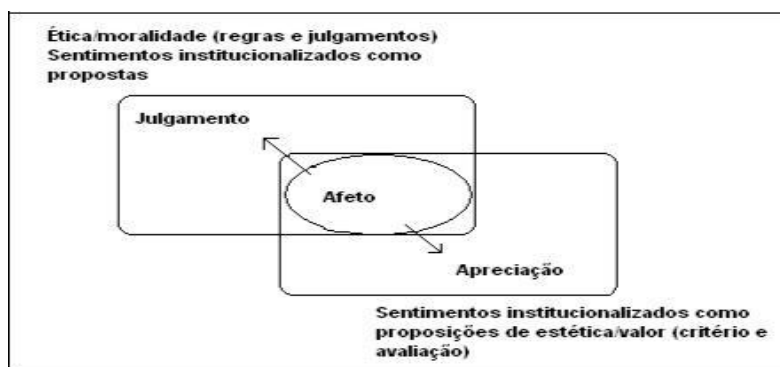
Figura 1: Juízo e apreciação como afeto institucionalizado [adaptado de Martin e White (2005: 45) 2 ]

A relação entre as regiões semânticas está representada na forma diagramática abaixo que apresenta a centralidade do afeto no domínio atitudinal.